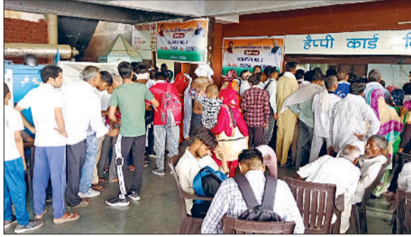
भिवानी। हैप्पी कार्ड लेने के लिए लाइनों में खड़े लाभार्थी व बस अड्डे पर कार्ड लेने के लिए उमड़ी भीड़।

सुनने में थोड़ा सा अजीब लगेगा, लेकिन यह सही है कि हैप्पी कार्ड वितरण में रोडवेज कर्मचारियों को जबर्दस्त पसीना बहाना पड़ रहा है। हालांकि रोडवेज विभाग ने हैप्पी कार्ड वितरण को लेकर 11 जगहों पर काउंटरो लगाए हैं, लेकिन उसके बावजूद पूरे दिन काउंटरो से लाभार्थियों की लाइनें नहीं टूट रही। सुबह से लेकर शाम तक रोडवेज कर्मचारी लाभार्थियों के कार्ड वितरण में जुटे हैं। हालात ये बने हैं कि कर्मचारियों को छुट्टी के बाद भी हैप्पी कार्ड वितरण करने पड़ रहे हैं। फिलहाल रोडवेज विभाग के पास 95 हजार हैप्पी कार्ड के लिए आवेदन पंजीकृत हो चुके हैं।