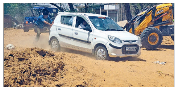
बाढ़ड़ा। रास्ते पर कार को धक्का देकर निकालते लोग।