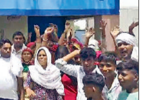
किरावड़ में पानी की समस्या को लेकर ग्रामीणों ने किया प्रदर्शन