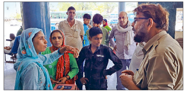
बाढ़ड़ा। बसें नहीं जाने पर रोडवेज कर्मों से बात करती महिला यात्री।