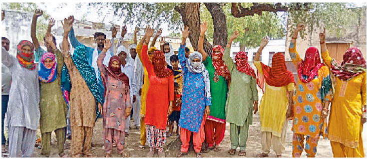
भिवानी। श्यामकला में सरपंच की अगुवाई में मटका फोड़ प्रदर्शन करती महिलाएं।