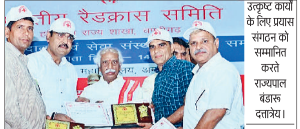
उत्कृष्ट कार्यों के लिए प्रयास संगठन को सम्मानित करते राज्यपाल बंडारू दत्तात्रेय।