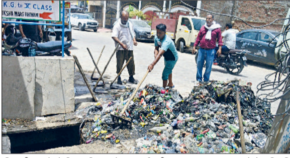
भिवानी। नाले से शिल्ट निकालते हुए कर्मचारी।

अब शहर के लोगों के लिए राहत भरी खबर है। प्री मानसून की बारिश में भी शहर में जलभराव नहीं होगा। क्योंकि नगरपरिषद ने शहर के नालों की गाद निकालनी शुरू कर दी है। हालांकि शहर में पब्लिक हेल्थ के भी नाले हैं, लेकिन नगरपरिषद ने उसके क्षेत्र या उनके अंतर्गत आने वाले नालों की ही सफाई करनी शुरू करवाई है। ताकि बारिश के दिनों में शहर में जलभराव की स्थिति न बन पाए। नगरपरिषद के आधीन करीब दस किलोमीटर लंबे नाले हैं। जिनकी सफाई की जिम्मेदारी नगरपरिषद की है। जानकारी के अनुसार नगरपरिषद ने प्री मानसून में शहर में जलभराव की समस्या से