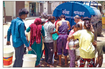
चरखी दादरी। टैंकर से पानी भरते लोग।