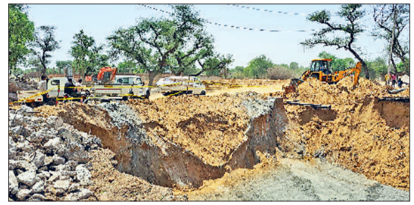
बाढ़ड़ा में सतनाली रोड पर चल रहा पुल निर्माण का कार्य।

हरिभूमि न्यूज ▶▶ बाढ़ड़ा बाढ़ड़ा कस्बे में सतनाली रोड पर नहर पर स्थित पुल को तोड़कर दोबारा से निर्माण कार्य किया जा रहा है। जिसके चलते बाढ़ड़ा सतनाली मुख्य सड़कमार्ग पर वाहन चालकों को भारी परेशानियों का सामना करना पड़ रहा है। वहीं बाढ़ड़ा से सतनाली रूट पर बसों का आवागमन पूरी तरह से प्रभावित होने के कारण यात्रियों को भी दिक्कतें उठानी पड़ीं। बाढ़ड़ा बस स्टैंड प्रभारी ने मांग की है कि बसों की आवाजाही का प्रबंध किया जाये ताकि गर्मी के मौसम में यात्रियों को परेशानी का सामना ना करना पड़े और वे अपने गंतव्य तक पहुंच सकें। बता दें कि सिंचाई विभाग द्वारा सड़क पर जो पुल है उनको तोड़कर नया बनाया जा रहा है। इसी कड़ी में बाढ़ड़ा-सतनाली सड़कमार्ग पर स्थित पुल को भी तोड़ा गया है और वहां पर निर्माण कार्य किया जा रहा है। लेकिन इस दौरान वहां से बसें व भारी वाहन नहीं निकल पा रहे हैं। जिससे यात्रियों व वाहन चालकों को परेशानी उठानी पड़ रही है। वहीं बालू मिट्टी होने के कारण छोटे वाहन निकालने में भी खासी दिक्कतें पेश आ रहे हैं। भिवानी, तोशाम आदि से सतनाली की ओर जाने वाले बसें बाढ़ड़ा बस स्टैंड से आगे नहीं जा पाईं। इसी दौरान जिन सवारियों ने तोशाम, भिवानी आदि से सतनाली का टिकट लिया था लेकिन बस बाढ़ड़ा से आगे नहीं जा पाने के कारण परिचालकों के साथ बहस करती भी नजर आई।