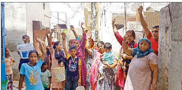
बवानीखेड़ा। पीने के पानी की मांग को लेकर प्रदर्शन करते हुए।