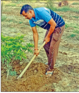
भिवानी। पौधों की देखभाल करते हुए।

हरिभूमि न्यूज,मिवानी मौसम विभाग के मुताबिक 30 जून तक हरियाणा में मानसून दस्तक दे सकता है, विभाग के मुताबिक करीब 16 व 17 जून तक मानसून महाराष्ट्र को कवर कर लेगा। इसके बाद 25,26 जून तक मध्यप्रदेश और गुजरात से होकर 30 जून तक दिल्ली,एनसीआर में प्रवेश करेगा। जिसके बाद बारिश से लोगों को गर्मी से राहत मिलेगी। हरियाणा एनसीआर में भी मानसून 30 जून को दस्तक दे सकता है। इस लिए पर्यावरण प्रेमी भी तैयार रहे और मानसून की दस्तक का पौधारोपण