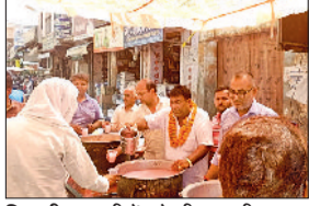
भिवानी। राहगीरों को मीठा पानी पिलाते दुकानदार।